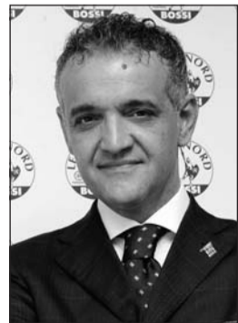
L'on. Angelo Alessandri

«È assolutamente indispensabile - ha commentato il sottosegretario alla Salute, Francesca Martini - che il Parlamento affronti il problema della macellazione rituale. Il confine è tra civiltà e inciviltà, tra rispetto della legge e crimini consumati a danno di animali indifesi. Non possiamo più accettare la barbarie. Occorre mettere all'ordine del giorno un tema che misura non tanto la nostra sensibilità quanto la democrazia di un Paese. Concorro con quanti, le associazioni in primis, dall'Enpa alla Lav, sollecitano che i tempi di una discussione politica entrino nel bagaglio della legislazione. A volte le stesse segnalazioni dei privati cittadini, come nel caso dell'Umbria, ci aiutano a capire il dilagare di un fenomeno che sfugge di