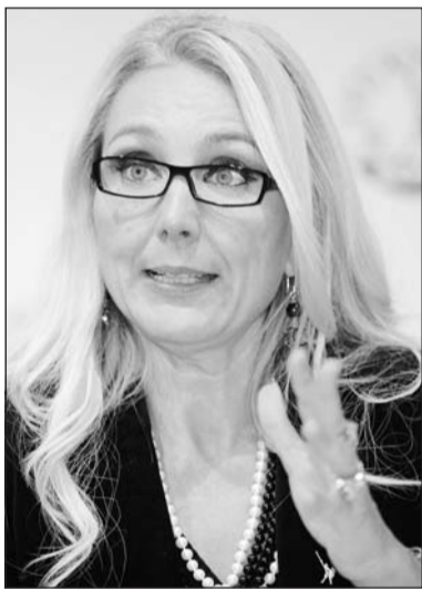
Il sottosegretario Francesca Martini

L'irrituale entra nell'ordinario. Nella vita di casa, mentre sei lì che fai la cameretta e riassetti, metti i cuscini sulla finestra e non scorgi il tuo vicino a curare fiori e