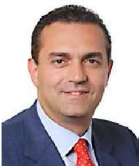
Luigi De Magistris