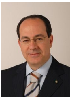
Paolo De Castro (Pd-Ds),

Presidente Commissione agricoltura e sviluppo rurale del Parlamento europeo