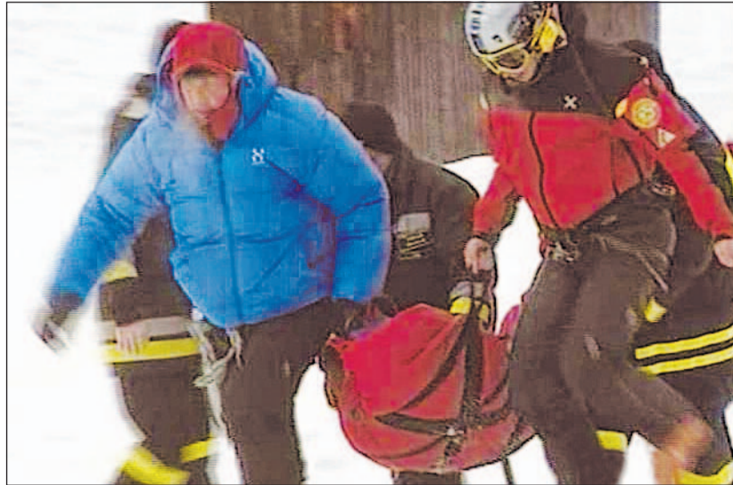
Le operazioni di soccorso dopo l'incidente in Alta Val di Fassa

In prossimità delle festività di fine anno, il Corpo forestale dello Stato sconsiglia le uscite fuori pista e raccomanda a chiunque si trovi in montagna di consultare sempre i bollettini quotidiani pubblicati dal Servizio Meteoromont sul sito www.meteoromont.org o attraverso il numero di emergenza ambientale 1515 del Corpo forestale dello Stato. Attraverso il monitoraggio dei parametri