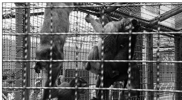
Lo stabulario delle scimmie

giù pesante, ritenendo che alcuni animali dell'Oasi siano stati sottoposti a maltrattamento con l'amputazione cruenta dell'ala per motivi che giudica futili, inconsistenti. Ma non gli basta: senza personale autorizzato né