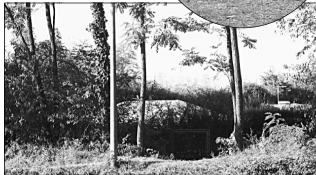
Dietro le recinzioni erbose una villa condonata, camper, roulotte e abusi edilizi