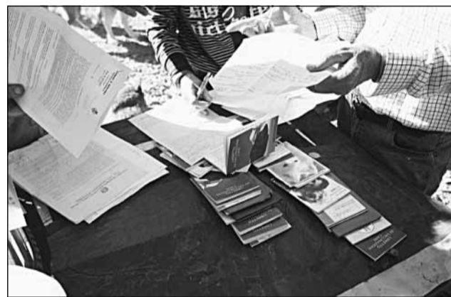
I libretti sanitari in regola accanto ai verbali dei Nas e l'ordine di sgombero delle cucce del Comune

«Pago tutto io - ci racconta mostrando con orgoglio una pila infinita di libretti sanitari in ordine - Tutti i cani sono vaccinati, le femmine sono sterilizzate. Tutti sono microchippati o tatuati». Ai quasi cinquanta ospiti a quattro zampe che circolano liberi nell'area recintata, senza litigare, senza mutilarsi, senza azzannarsi come accade nei canili comunali sovraffollati, lei assicura tutto: cibo, cure veterinarie, operazioni, medicine, un tetto. Rispetta lei più dei sindaci la legge 281 del '91 sul randagismo, che obbliga i sindaci in prima persona a garantire il benes-